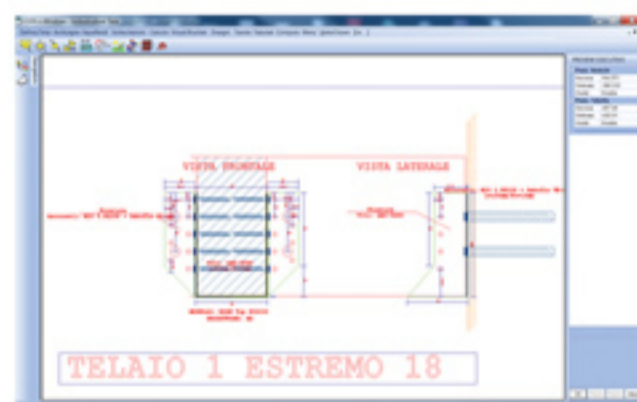
Trave ancorata con Scarpetta